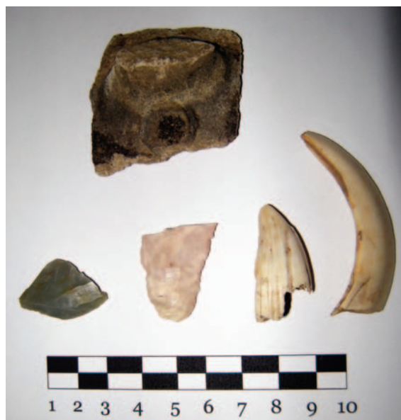
Слика 27. Налази са локалитета „Чанд“ у селу Свилеува

Географске координате локалитета „Чанд“ у селу Свилеува су: \varphi = 44^{\circ} 30' 37.89'' ; \lambda = 19^{\circ} 49' 54.65'' ; I = 139 м.